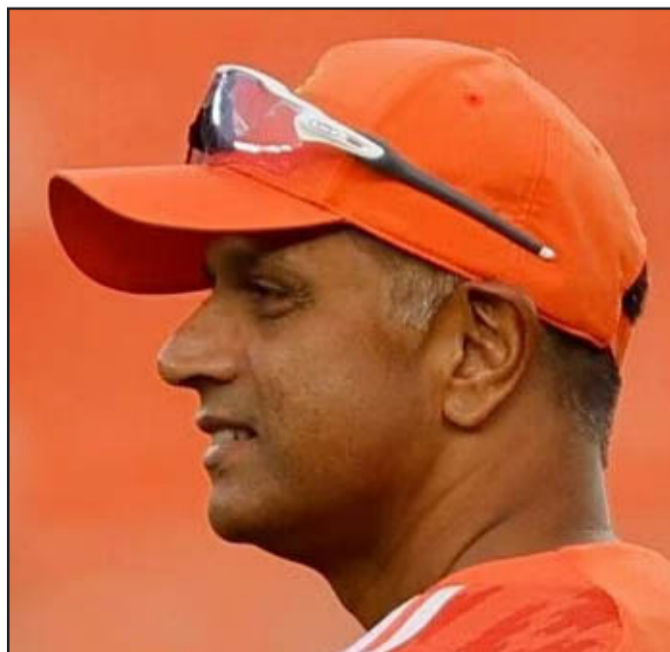
ਅਧਿਕਾਰੀ ਨੇ ਨਾਂ ਨਾ ਛਾਪਣ ਦੀ ਸ਼ਰਤ 'ਤੇ PTI ਨੂੰ ਦੱਸਿਆ, ਸਥਿਤੀ 'ਤੇ ਚਰਚਾ ਕੀਤੀ। ਅਸੀਂ

ਨਵੀਂ ਦਿੱਲੀ: ਭਾਰਤੀ ਕ੍ਰਿਕਟ ਕੰਟਰੋਲ ਬੋਰਡ (BCCI) ਦੇ ਉੱਚ ਅਧਿਕਾਰੀਆਂ ਨੇ ਮੁੱਖ ਕੋਚ ਵਜੋਂ ਰਾਹੁਲ ਦ੍ਰਾਵਿੜ ਦੀ ਭੂਮਿਕਾ ਦੀਆਂ ਸੰਭਾਵਨਾਵਾਂ 'ਤੇ ਉਨ੍ਹਾਂ ਨਾਲ ਡੂੰਘਾਈ ਨਾਲ ਗੱਲਬਾਤ ਕੀਤੀ, ਪਰ ਬੋਰਡ T-20 ਵਿਸ਼ਵ ਕੱਪ 2024 ਨੂੰ ਧਿਆਨ 'ਚ ਰੱਖਦੇ ਹੋਏ ਕਿਸੇ ਨਵੇਂ ਵਿਅਕਤੀ ਨੂੰ ਜ਼ਿੰਮੇਵਾਰੀ ਸੌਂਪਣ 'ਤੇ ਵਿਚਾਰ ਕਰ ਰਿਹਾ ਹੈ। ਬੋਰਡ ਜਿਸ ਵਿਅਕਤੀ ਦੇ ਨਾਂ 'ਤੇ ਵਿਚਾਰ ਕਰ ਰਿਹਾ ਹੈ, ਉਹ ਹੈ NCA (ਨੈਸ਼ਨਲ ਕ੍ਰਿਕਟ ਅਕੈਡਮੀ) ਦੇ ਡਾਇਰੈਕਟਰ ਵੀ. ਵੀ. ਐੱਸ. ਲਕਸ਼ਮਣ। ਭਾਰਤ ਦੇ ਮੁੱਖ ਕੋਚ ਵਜੋਂ ਦ੍ਰਾਵਿੜ ਦਾ ਦੋ ਸਾਲ ਦਾ ਕਰਾਰ ਹਾਲ ਹੀ 'ਚ ਵਿਸ਼ਵ ਕੱਪ ਫ਼ਾਈਨਲ ਦੇ ਦਿਨ ਖ਼ਤਮ ਹੋ ਗਿਆ ਸੀ। ਉਦੋਂ ਤੋਂ ਹੀ ਦ੍ਰਾਵਿੜ ਦੇ ਭਵਿੱਖ ਨੂੰ ਲੈ ਕੇ ਲਗਾਤਾਰ ਬਹਿਸ ਹੋ ਰਹੀ ਹੈ। BCCI ਦੇ ਇੱਕ