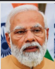
Narendra Modi Prime Minister

TODAY marks 365 days since India assumed the G20 presidency. It is a moment to reflect, recommit and rejuvenate the spirit of Vasudhaiva Kutumbakam, 'One Earth, One Family, One Future.'