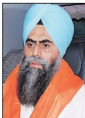
ਭੁੱਲਰ ਦੀ ਸਮੇਂ ਤੋਂ ਪਹਿਲਾਂ ਰਿਹਾਈ ਦੇ ਮਾਮਲੇ 'ਚ ਚਾਰ ਹਫ਼ਤਿਆਂ ਦੇ ਅੰਦਰ ਫ਼ੈਸਲਾ ਕੀਤਾ ਜਾਵੇਗਾ। ਇਹ

ਹਾਈਕੋਰਟ ਦੇ ਅਧਿਕਾਰ ਖੇਤਰ ਦੇ ਅਧੀਨ ਅਦਾਲਤ 'ਚ ਨਹੀਂ ਸੀ ਚੱਲ ਰਿਹਾ, ਇਸ ਲਈ ਉਸ ਵਲੋਂ ਦਾਇਰ ਪਟੀਸ਼ਨ ਸੁਣਵਾਈ ਯੋਗ ਨਹੀਂ। ਹਾਈਕੋਰਟ ਨੇ ਦਿੱਲੀ ਸਰਕਾਰ ਦਾ ਪੱਖ ਸੁਣਨ ਮਗਰੋਂ ਸੁਣਵਾਈ ਮੁਲਤਵੀ ਕਰ ਦਿੱਤੀ।